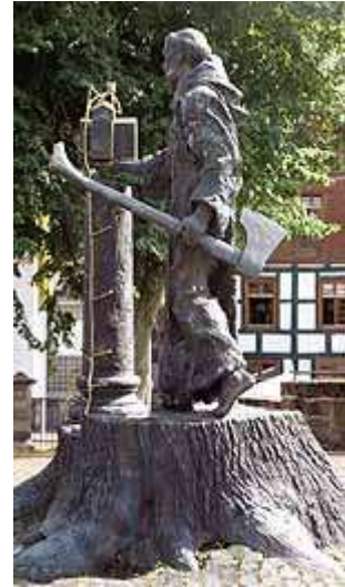
Bonifatius als kerkbouwer

Ruim twintig jaar eerder had Willibrord de burcht Traiectum (Utrecht) als basis voor missionering onder de Friezen toegewezen gekregen. Hij kon echter weinig aanvangen met de hem vijandige Friezen zonder de fysieke steun van de Frankische machthebbers. Daarom had Willibrord zijn werkgebied naar het volledig door de Franken beheerste zuiden verlegd.