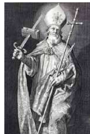
Bonifatius met mijter en zwaard, een anachronistische voorstelling uit de 17e eeuw