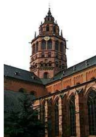
De aartsbisschoppelijke zetel in Mainz