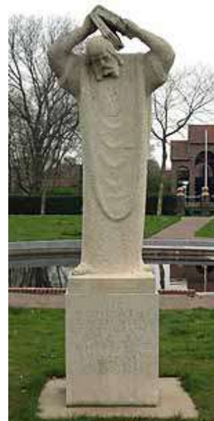
Bonifatius als martelaar