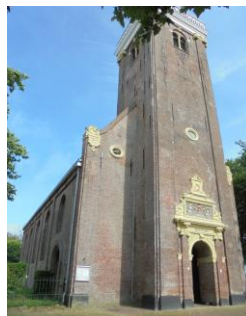
De kerk in Aldeboarn, open voor bezoekers.

Foto's en tekst: Kees Slijkerman 27-12-2023