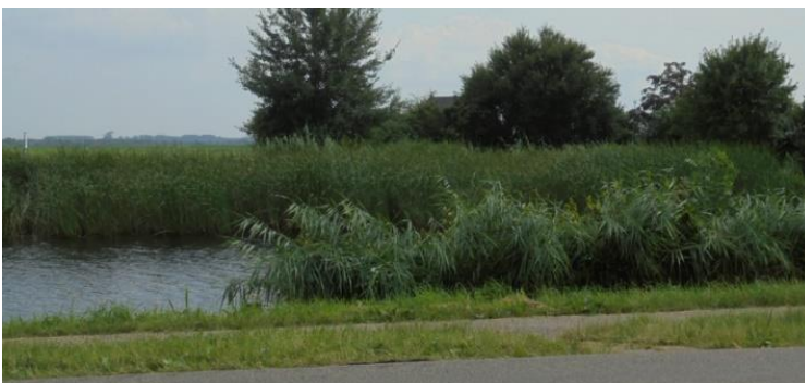
De Boorne ten oosten van Aldeboarn.

Het enige wat ik zou kunnen concluderen uit de bronnen is: aan de oever van de Boorne/ Middelsee.”